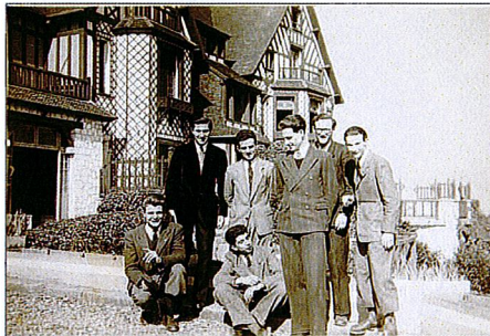
Troisième promotion de bacheliers de Saint-Adjutor