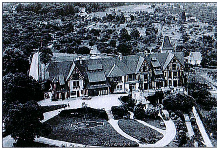
Le site après le rachat par le diocèse, dans les années 40